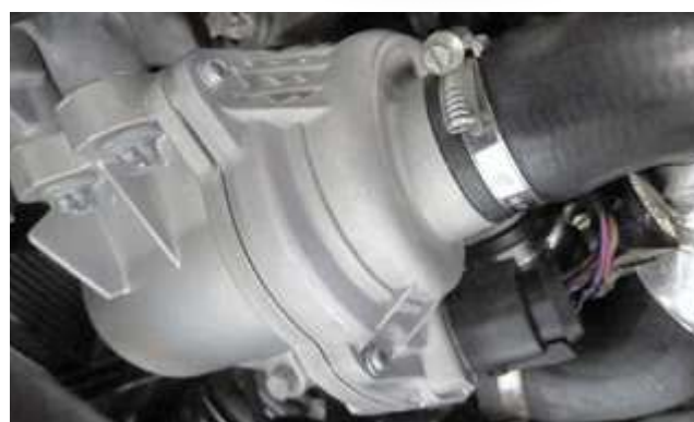
Eingebaut im Fahrzeug