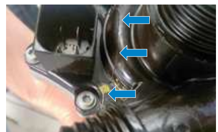
Möglicherweise auftretendes Problem der Serienpumpe: Bruch des Kunststoffgehäuses.

Änderungen und Bildabweichungen vorbehalten. Zuordnung und Ersatz, siehe die jeweils gültigen Kataloge bzw. die auf TecAlliance basierenden Systeme.